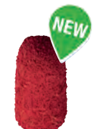
D 9634/3 - Tipo SK