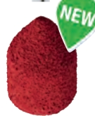
D 9627/3 - Tipo SK