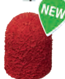
D 9631/3 - Tipo SK