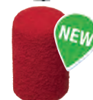
D 9623/3 - Tipo SK