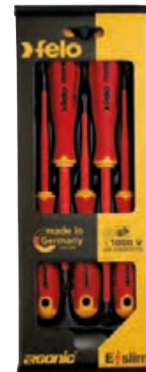
M 7101/85 - E/slim