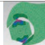
CHIAVE A FORCHETTA COMUNE: gioco sugli spigoli causa danneggiamenti