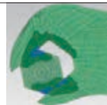
PINZA CHIAVE: superfici di serraggio senza gioco