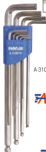
A 3109/75 gr. 9