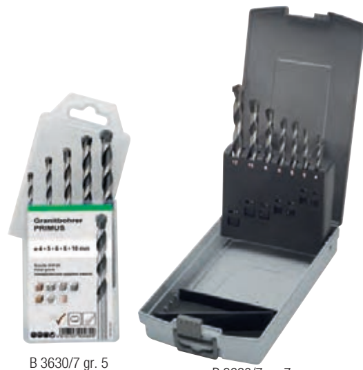
B 3630/7 gr. 5