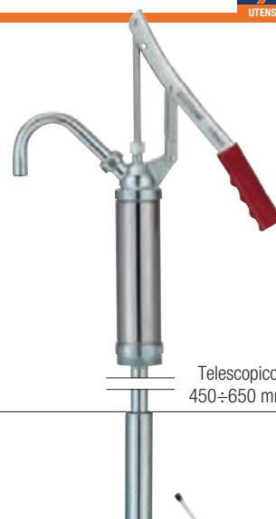
Telescopico 450÷650 mm