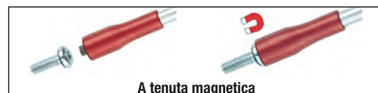
A tenuta magnetica