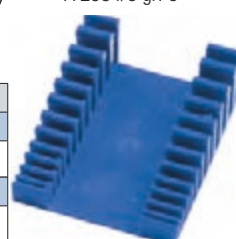
A 2934/8 gr. 12