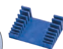
A 2934/8 gr. 8