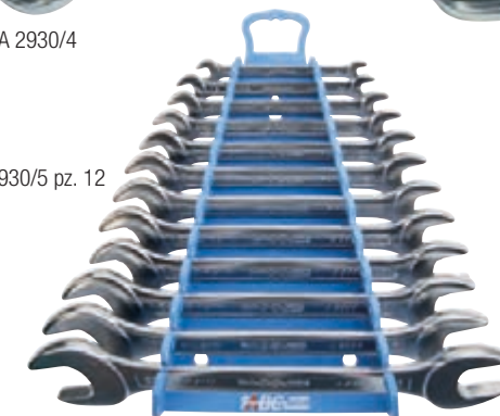
A 2930/5 pz. 12