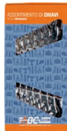
A 2930/1 pz. 8