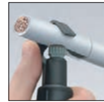
Regolazione della profondità di taglio