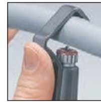
Arco di tenuta autoserrante