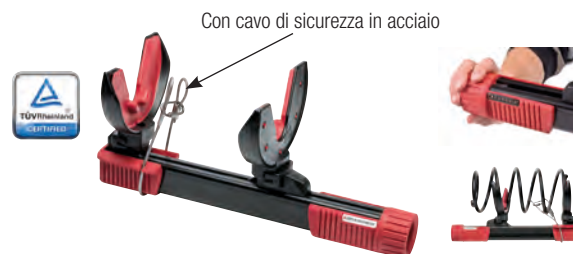
Con cavo di sicurezza in acciaio