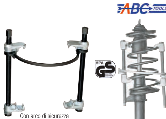
Con arco di sicurezza