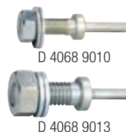
D 4068 9010