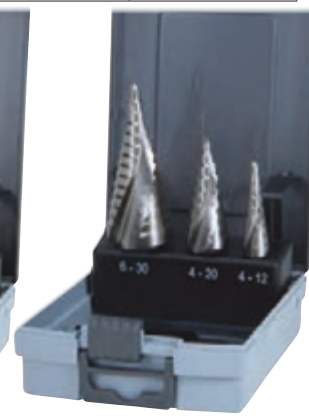
F 7596/3 - F 7596/33