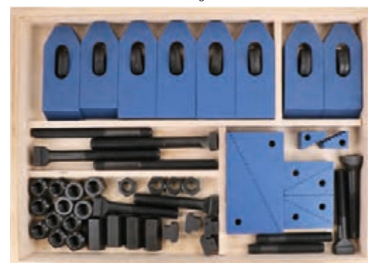
G 3753 gr. 16