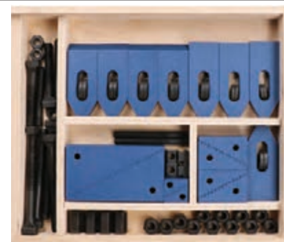
G 3753 gr. 12