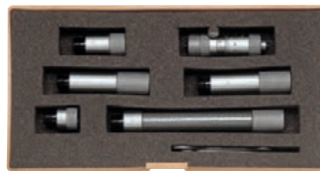
H 4302 gr. 300