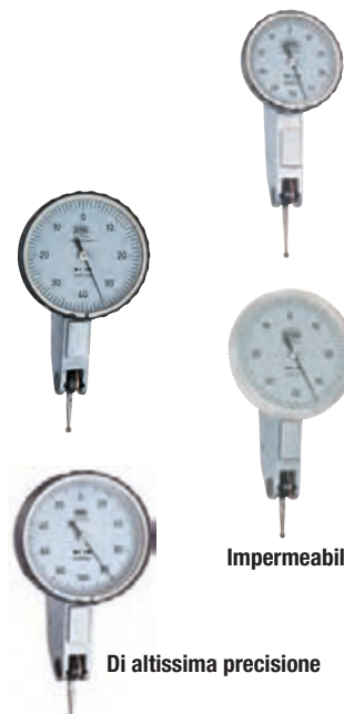
Di altissima precisione