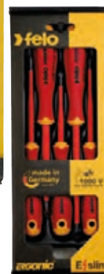
M 7101/85 E/slim