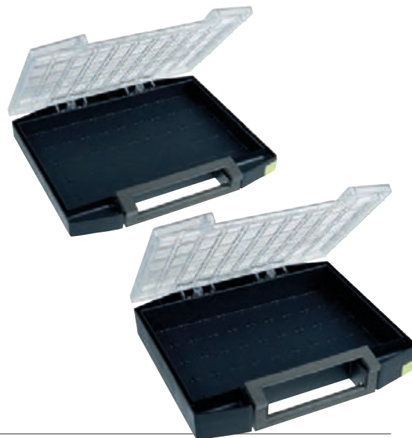
Altezza valigetta 55 mm