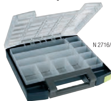
N 2716/1 gr. 13