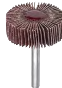
Al corindone con legante abrasivo per acciaio INOX

Al corindone per impiego frontale e laterale