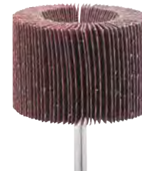
Esecuzione per impiego frontale e laterale

Esecuzione ceramicata - Velocità di rotazione max. 12700 giri/min