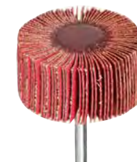
Lamelle Ceramic: elevata asportazione, autoriaffilante, maggiore aggressività e durata