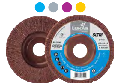
Platorello (supporto) in NAWAROFLEX®