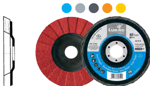
CERAMIC - Heavy Duty