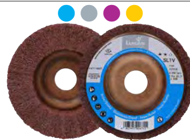
Platorello (supporto) in NAWAROFLEX®