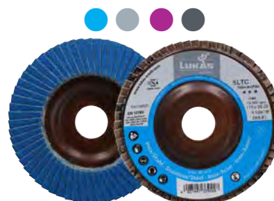
Platorello (supporto) in NAWAROFLEX®