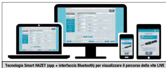
Tecnologia Smart HAZET (app + interfaccia Bluetooth) per visualizzare il percorso della vite LIVE