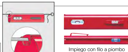
Impiego con filo a piombo