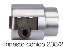
Innesto conico 238/2