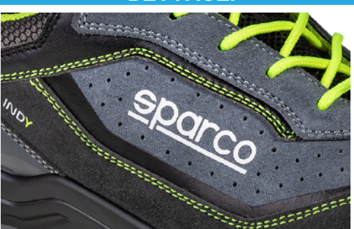
LOGHI e DECORAZIONI realizzati in microiniezione TOMAIA in pelle scamosciata traforata