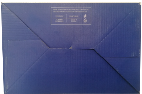
SCATOLA SCARPE SPARCO TEAMWORK in cartone blu-bianco-arancio e carta velina interna protettiva. Dimensioni 343x188x123 mm

Indicazioni per il riciclo valide per l'ITALIA sul fondo (PAP20)