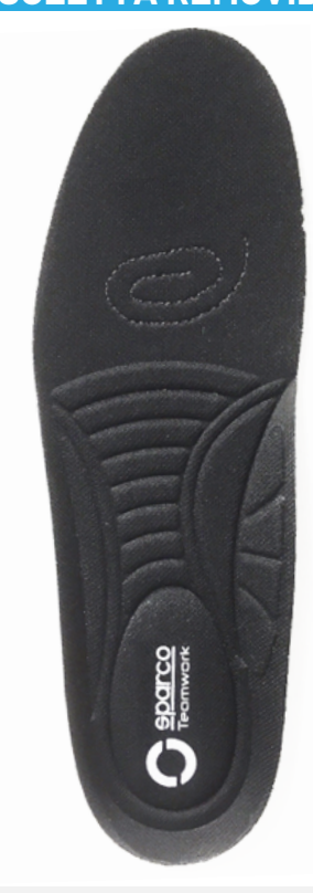
SOLETTA REMOVIBILE antistatica in morbido poliuretano con termoformatura ergonomica.