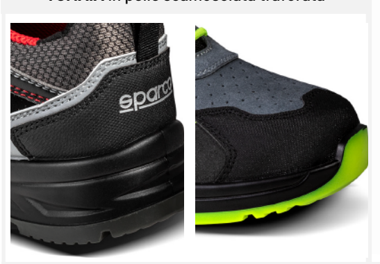
RINFORZO ANTIABRASIONE in microfibra su punta e tallone.