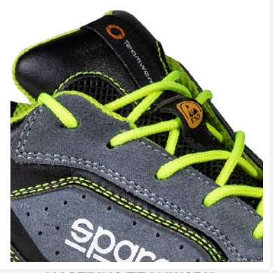
NASTRINO TEAMWORK cucito sulla linguetta (15x60 mm) e ETICHETTA ESD stampata su passalacci