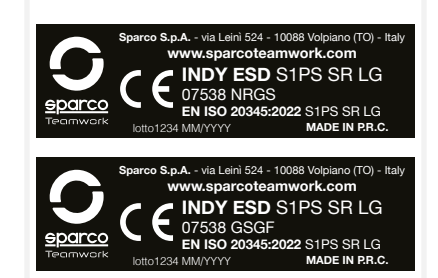
ETICHETTA "CE" INTERNA all'interno della linguetta Dim. 50 x 15 mm