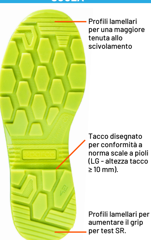
SUOLA in poliuretano bidensità con speciale disegno dei tasselli che garantiscono il massimo grip in tutte le condizioni di appoggio ed in ogni condizione di flessione. CONFORME SR + LG